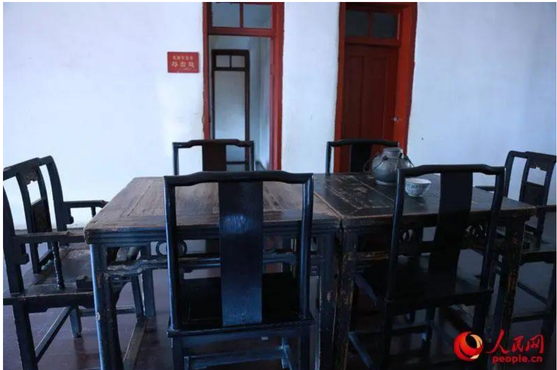
1930年5月，毛泽东同志进行寻乌调查的旧址

调查开始之前，毛泽东在对寻乌基本情况进行摸底了解的基础上，亲自准备和拟定调查纲目，既有大纲，也有细目。他共列出5个大目，每个大目之下又列出几个至十几个细目，在细目之下再列出作讨论式调查的具体问题。针对每个具体问题，他都有针对性地选择了调查对象。比如，关于寻乌的交通，他具体分析了水路、陆路、电报、邮政、陆路交通工具的情况；关于寻乌的商业，他具体调查了从门岭到梅县、从安远到梅县、从梅县到门岭、从梅县到安远与信丰经寻乌的生意情况，以及惠州来货、寻乌的出口货、寻乌的重要市场等情况，并详细调查了寻乌城市场各种货物的种类、店铺分布、经营品种、货物来源、市场价格、店员制度等情况；关于寻乌的旧有土地关系，他对寻乌8个头等大地主、12个二等大地主、113个中地主的的具体情况一一进行了分析；关于寻乌的土地斗争，他从分配土地的方法、山林分配、池塘分配、房屋分配等17个方面进行了深入调查……寻乌调查因细致入微，获取的资料十分翔实。