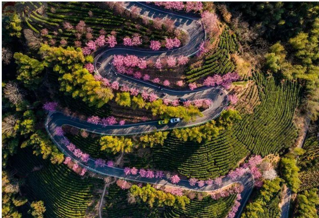
洪福茶山

用好革命老区自身资源优势，大力发展特色产业，是实现脱贫致富的重要途径。在老县镇调研的第四站，习近平总书记选择了女娲凤凰茶业现代示范园区。在园区，他拾级而上，步入茶园，沿途察看春茶长势，同茶农们亲切交谈，仔细询问茶叶收成、价格和村民土地流转、参加分红、务工收入等情况。针对了解到的情况，他强调“绿水青山既是自然财富，又是经济财富”，并勉励乡亲们坚定不移走生态优先、绿色发展之路，脱贫奔小康。